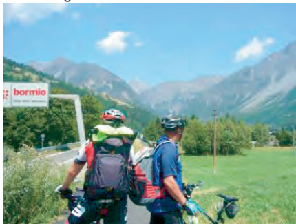
Einfahrt bei glühender Hitze am Mittag in Bormio

Den 3. Tag hatten wir auch dieses Jahr als die sogenannte „Ausruhetappe“ geplant. Bei herrlichem und aber heißem Wetter ging es wie am Nachmittag des Vortages steil bergab bis zur Landesgrenze Schweiz - Italien in Tirano. Der gute Tip des Hotelchefs in La-Prese lässt uns auch heute den Radweg in Tirano hinauf nach Bormio schnell finden. Wieder fahren wir nicht auf der stark befahrenen Bundesstraße, sondern durch kleine italienische Dörfer mit engen Gassen. Dies ist sehr wichtig, denn es wird jeden Tag heißer und da tut der Schatten zwischen den Häusern gut.