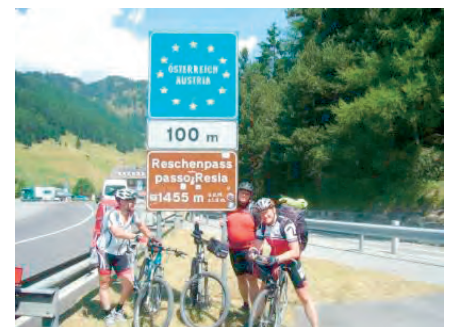
unser 3. „Passfoto“ 2015

Danach ging es zügig weiter über den letzten Pass der Tour 2015 und später passierten wir in Martina erneut die Grenze und erreichten am Nachmittag unseren Ausgangspunkt wieder.