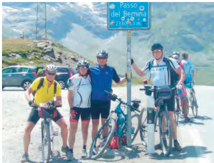
unser erstes „Passfoto“ 2015

Viel unglaublicher ist aber das Panorama in dieser Höhe. Bei bestem Wetter verspeisen wir auf der Terrasse die verdienten Nudeln.