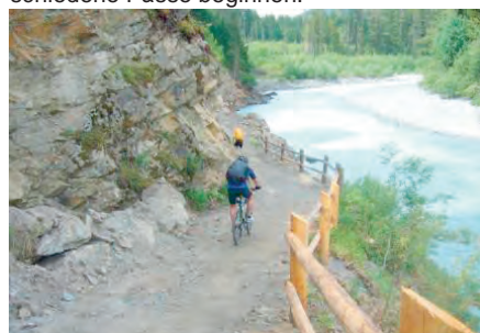
Radeln am oberen Inn

tina die Grenze erreicht. Inzwischen lacht die Sonne und es wird ordentlich warm. Ab Martina entscheiden wir uns nicht für die leichtere Straßenfahrt, sondern wir fahren auf halber Höhe durch urige Dörfer der Schweiz unserem Tagesziel entgegen. Das ständige Auf und Ab, sowie die steigende Hitze verlangen einiges von uns. Wir erreichen unser Tagesziel, die Stadt Zernez am Nachmittag und lernen, dass sie ein reines Radsportmekka ist, weil hier viele Touren über verschiedene Pässe beginnen.