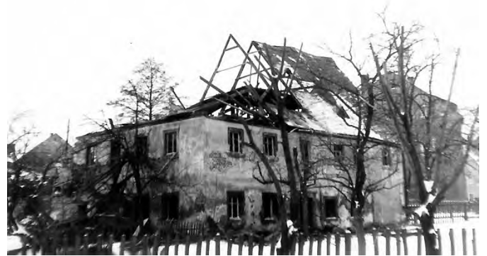
1972 – Abriss

Der Abriss dieses alten Schmiedegebäudes erfolgte 1972 und nach 1990 wurde auf einem Teil der Fläche ein Parkplatz errichtet und der Rest ist eine ausgewiesene Baufläche.