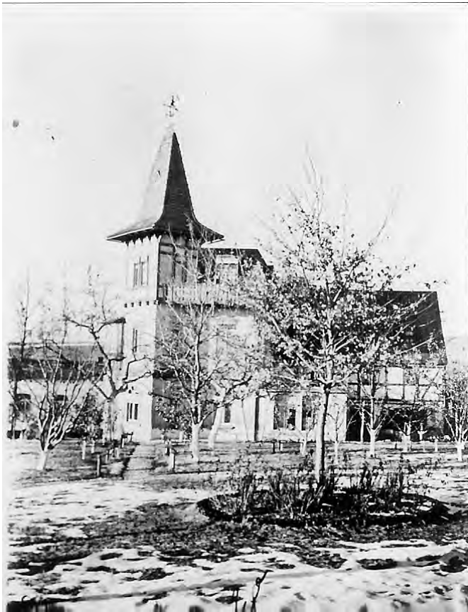
1924- Kurz vor Abriss