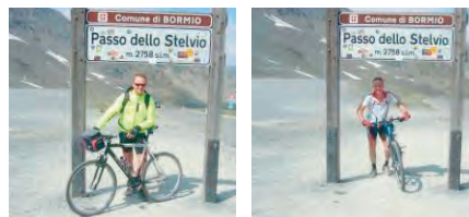
der neue Höhenrekord mit 2.758 m ist wahr geworden

Im kaufmännischen Prad stärken wir uns, bevor wir in Richtung Vinschgau die wohl spektakulärste Abfahrt aller unserer bisherigen Touren beginnen.