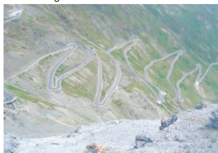
Blick auf die Talabfahrt

Im kaufmännischen Prad stärken wir uns, bevor wir in Richtung Vinschgau die wohl spektakulärste Abfahrt aller unserer bisherigen Touren beginnen.