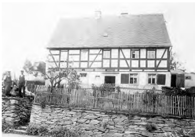
um 1908-links 3mal ...