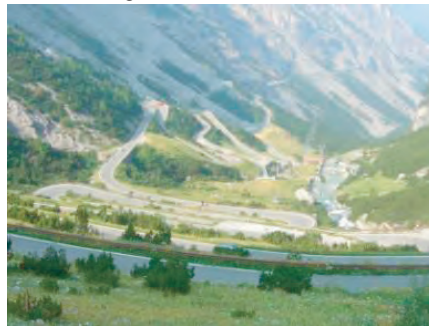
die Auffahrt von oben

Wenn man es nicht selbst erlebt hat, dann glaubt man kaum wie diese Auffahrt nach dem Aufstieg von oben aussieht.